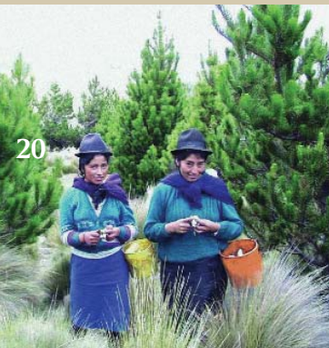
Gombatermesztők. Mcch, Salinas, Ecuador

Az éhezés megszüntetése lehetséges, ez mindannyiunk felelőssége!