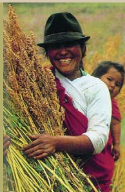
Quinoa aratás. Anapqui, Bolívia