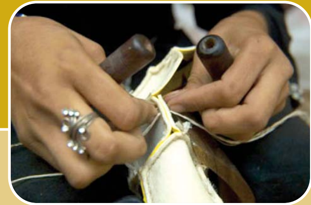
A gepa német fair trade nagykereskedés képtárából