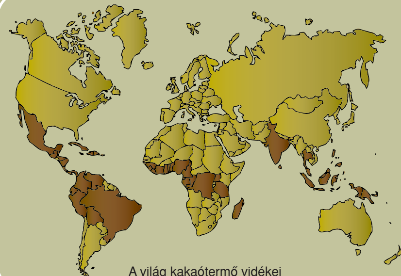
A világ kakaótermő vidékei

A méltányos kereskedelem a nemzetközi árucserre szokásos felfogásától eltérő megközelítés. Kereskedelmi partnerséget jelent, amely a piacról kizárt, hátrányos helyzet termelők számára hivatott a fenntartható fejlődést előmozdítani elsősorban jobb kereskedelmi feltételek biztosításával.